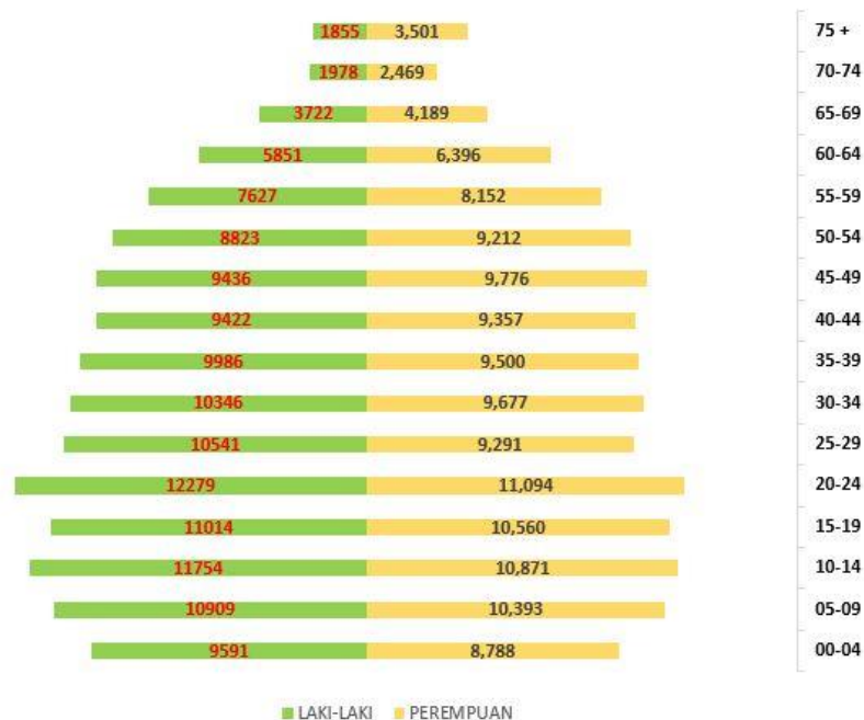
Gambar 3.2.6 Piramida Kependudukan Kab. Hulu Sungai Tengah

Pada gambar 3.2.6 piramida penduduk menggambarkan Kabupaten Hulu Sungai Tengah dengan pertumbuhan yang stabil atau bisa kita sebut piramida penduduk dewasa atau stationer. Pada piramida penduduk dewasa, angka kelahiran dan angka kematian cenderung seimbang. Informasi yang bisa kita dapat yaitu jumlah penduduk dalam keadaan stationer, jumlah kelahiran dan kematian seimbang, jumlah penduduk relatif tetap, pertumbuhan penduduk rendah serta penduduk muda hampir sebanding dengan penduduk tua.