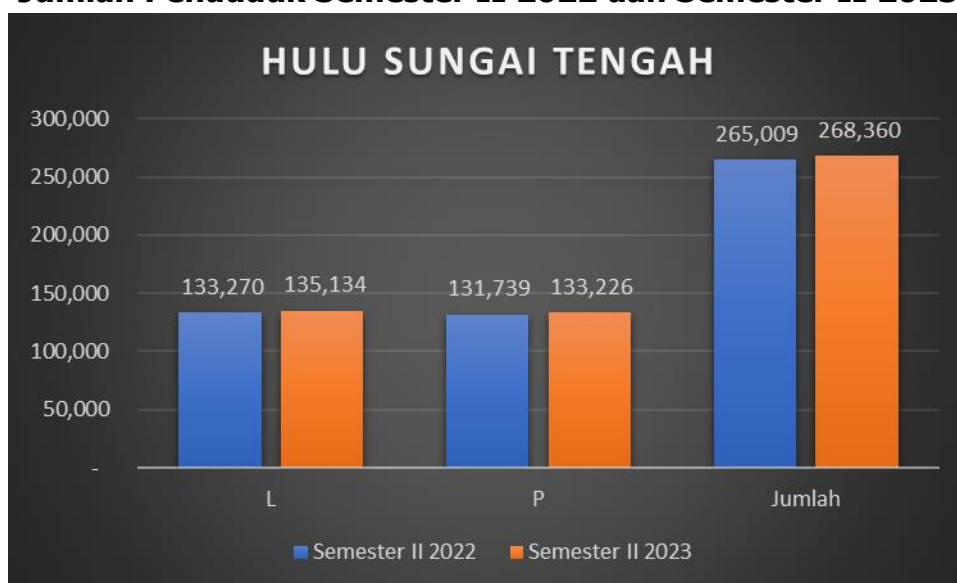
Gambar 3.2.2.1 Jumlah Penduduk Semester II 2022 dan Semester II 2023