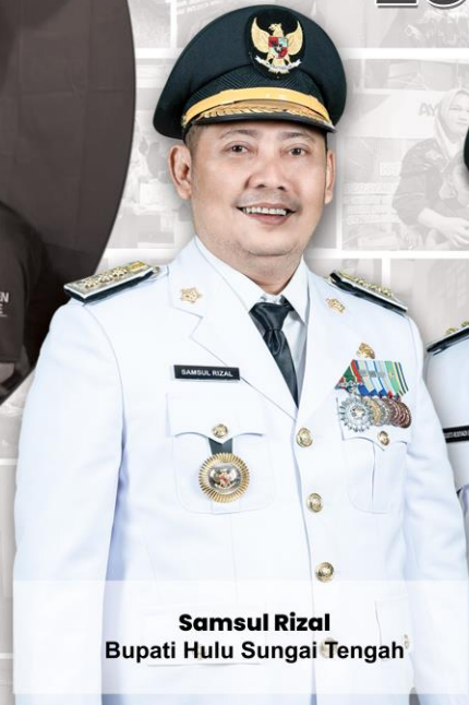
Samsul Rizal Bupati Hulu Sungai Tengah